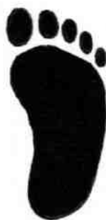
Insigne de classe « FOOTY » grandeur nature